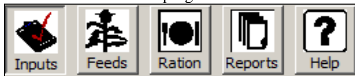
Slika 3. Osnovni meni programa - traka sa alatima.

Osnovnim funkcijama programa se pristupa preko opcije fajl i to: